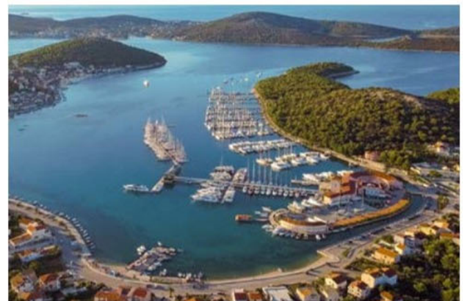
▲ Niewielkie porty dla żaglówek – mariny – są elementem infrastruktury turystycznej wybrzeży Morza Śródziemnego (fot. Chorwacja).