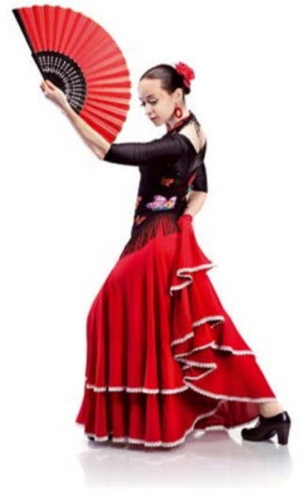
▲ Flamenco [wym. flamenko] wywodzi się z Hiszpanii. Wykonujące je tancerki są ubrane w efektowne, ozdobione falbanami suknie.

Do Europy Południowej turystów przyciągają również walory kulturowe . To tam rozwinęły się cywilizacje starożytnej Grecji i starożytnego Rzymu. Została po nich ogromna liczba imponujących zabytków, np. Koloseum w Rzymie czy Akropol w Grecji. Zabytki późniejszych okresów to głównie piękne starówki takich miast, jak Wenecja czy Dubrownik, świątynie (np. katedry), a także liczne muzea. Dla turystów interesujący jest również folklor krajów śródziemnomorskich – ich kuchnia, tańce (np. flamenco) oraz festiwale.