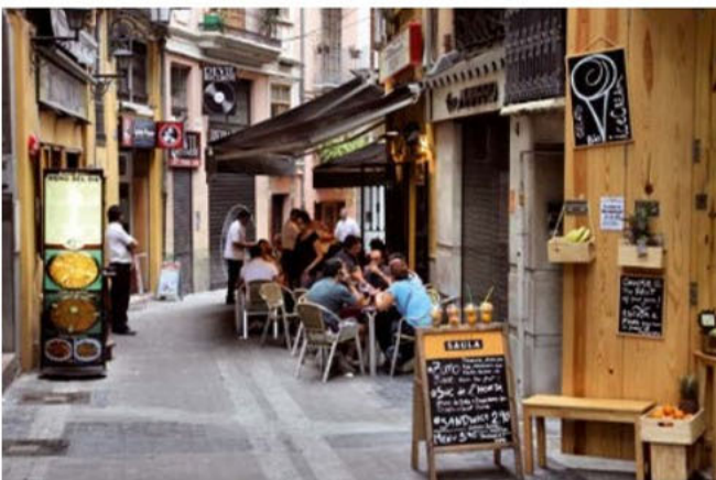
▲ Na starówkach śródziemnomorskich miast, w wąskich uliczkach, funkcjonuje wiele małych kawiarni i restauracji (fot. Hiszpania).

W większości krajów Europy Południowej infrastruktura turystyczna jest bardzo dobrze rozwinięta. Turyści korzystają z gęstej sieci autostrad, wielu międzynarodowych lotnisk i promów. Czekają na nich także liczne i zróżnicowane miejsca noclegowe: od kempingów po wysokiej klasy hotele. Nawet w niewielkich miejscowościach istnieją restauracje, kawiarnie i sklepy. Plaże są dobrze przygotowane, a zabytki – zadbane.